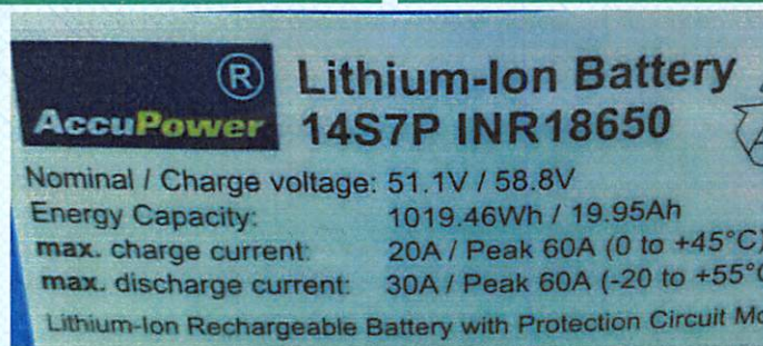
测试结论 Test Conclusion

测试样品符合《试验和标准手册》第七修订版第III部分 38.3 章节要求。 The tested samples meet the requirements of test items of the Manual of Tests and Criteria ST/SG/AC.10/11/Rev.7 Part III sub-section 38.3.